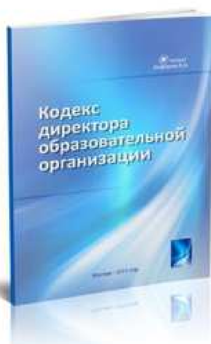
Кодекс Директора образовательной организации