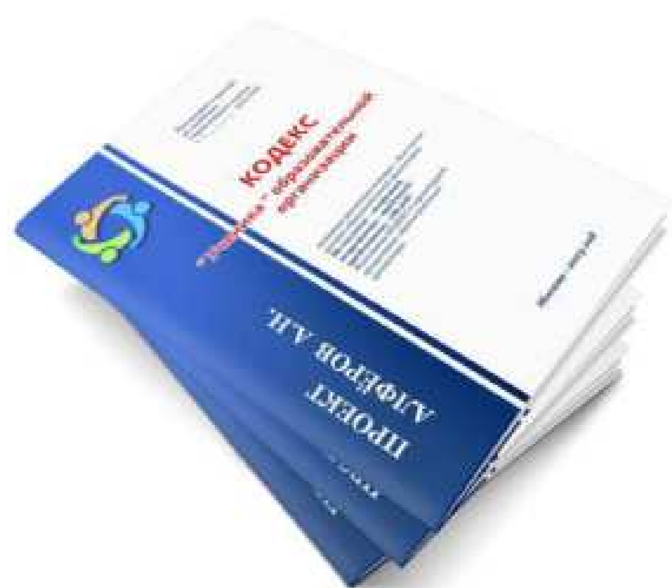
Кодекс Ученика образовательной организации