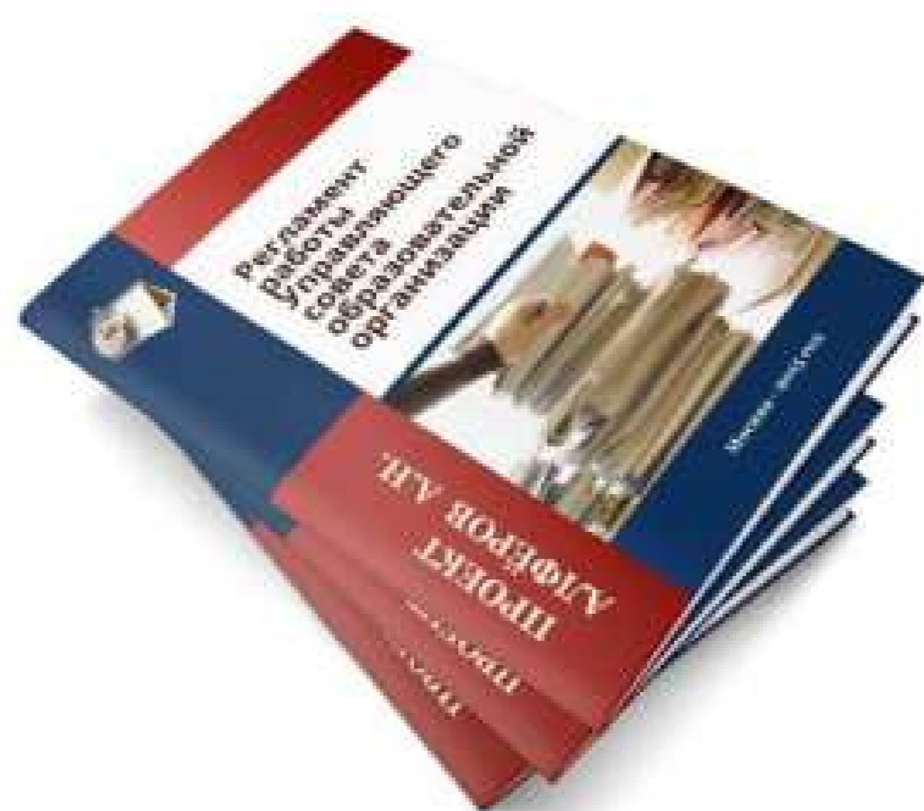
Регламент работы Управляющего совета образовательной организации