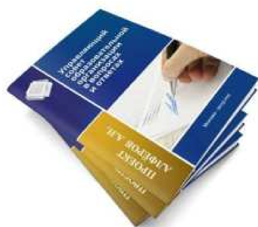
Сайт Управляющего совета образовательной организации

Управляющий совет образовательной организации в вопросах и ответах