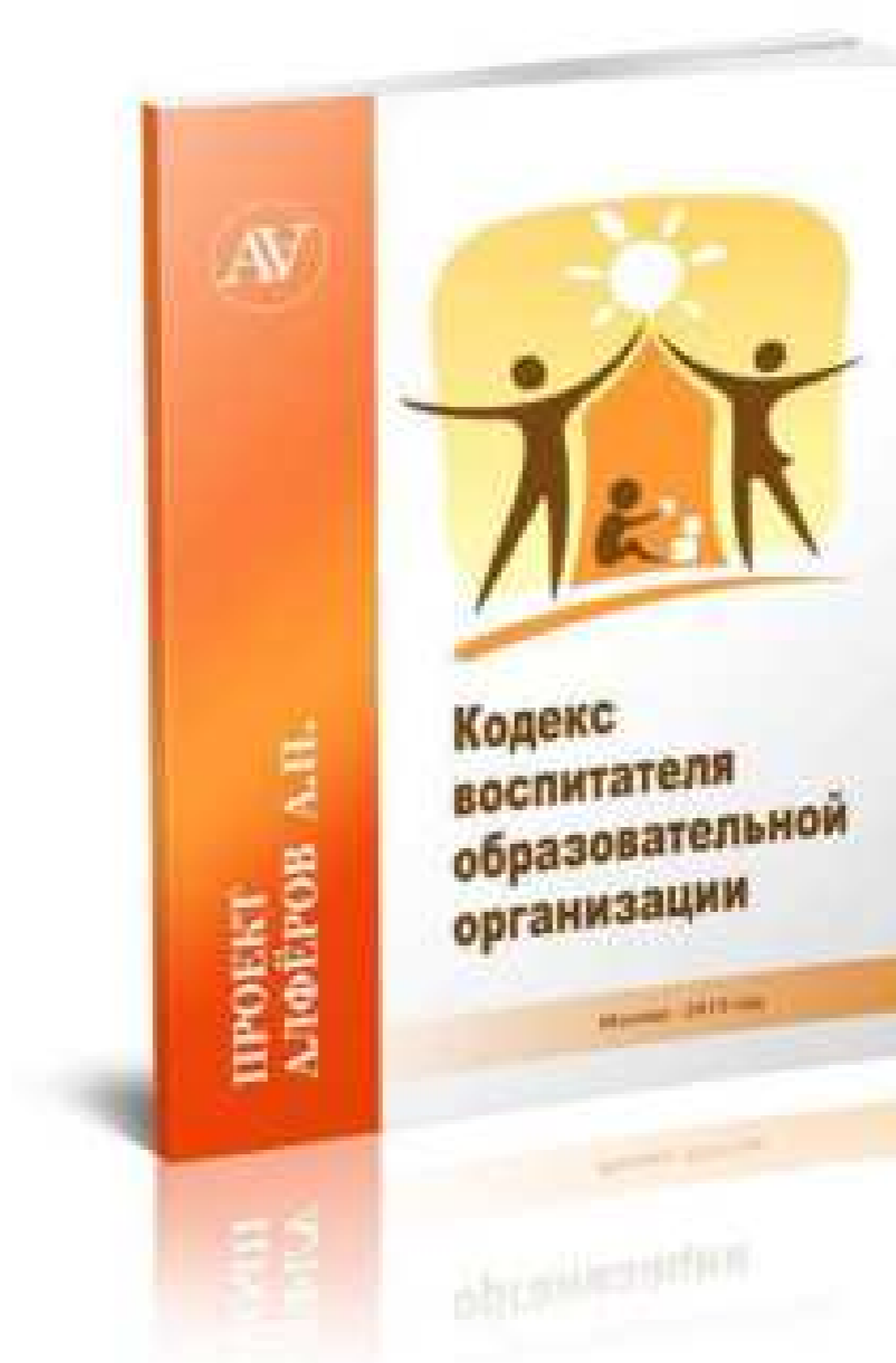
Кодекс воспитателя образовательной организации